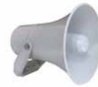
TÉLÉ-INTERPELLATION AUDIO & VIDÉO

Très grande sensibilité - Qualité d'image exceptionnelle y compris en mode nocturne