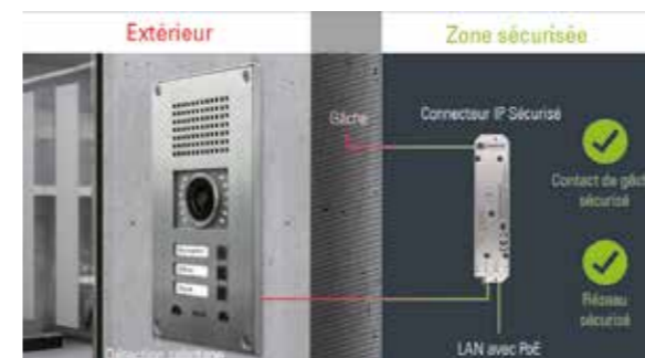
CONNECTEUR IP - GAMME WS 300V

Protection de l'intégrité de votre réseau Sécurisation de l'accès au bâtiment Neutralisation de l'ouverture en cas d'acte malveillant